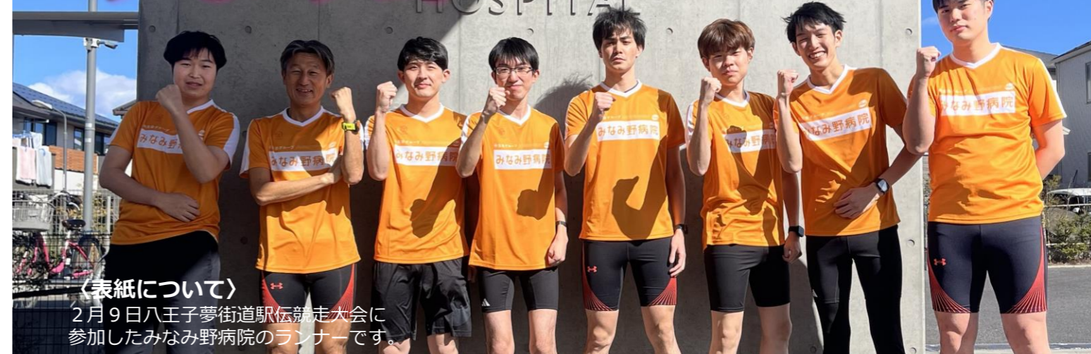
（表紙について） 2月9日八王子夢街道駅伝競走大会に参加したみなみ野病院のランナーです。

eisei 医療法人社団永生会 みなみ野病院広報誌 2025年3月発行 Vol.25 Take Free