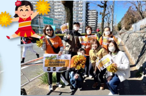
〈みなみ野病院応援団〉 チームカラーのオレンジ色の応援グッズを準備し、精一杯声援を送りました。